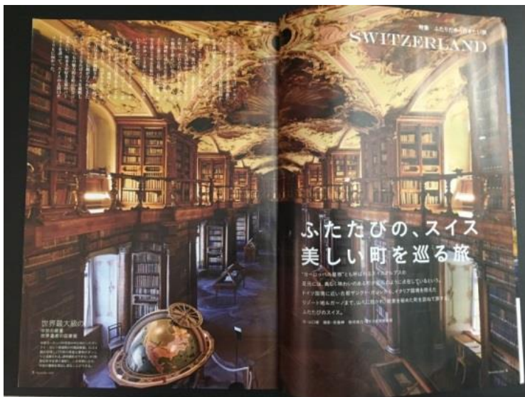
Colorful Magazin

Dank privater Initiative der Plattform Zukunftsmärkte kann ein einfaches Marketing mit Schweiz Tourismus auch in China, Südostasien, Korea und Japan umgesetzt werden. Entsprechend konnte St.Gallen-Bodensee Tourismus das Medieninteresse aus diesen Ländern markant steigern. Alleine 2016 waren 126 Teilnehmer aus den genannten Märkten. Eine wichtige Grundlage in diesem Kulturmarketing sind auch die Marketing Kooperationen mit Swiss Cities und WHES die sich vor allem auf Europa und den Schweizer Markt ausrichten. Der Medienspielgel 2016 von St.Gallen-Bodensee Tourismus weist eine Kontaktzahl von über 200 Millionen aus, mit einem starken Fokus auf das Weltkulturerbe.