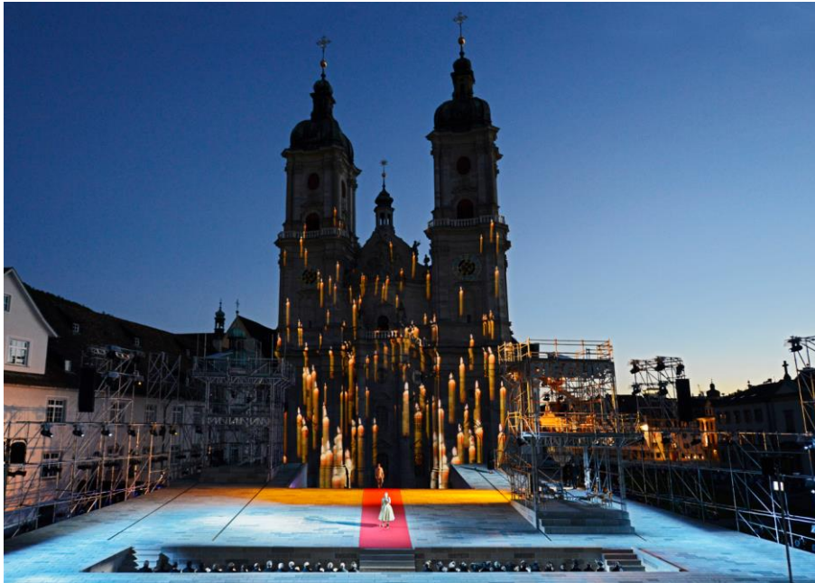
11. St.Galler Festspiele

Im Jahr 2016 haben vielfältige kulturelle Aktivitäten den Stiftsbezirk St.Gallen belebt und für ein bunt gemischtes Publikum attraktiv gemacht. Viel beachtet waren die 11. St.Galler Festspiele, die sich erneut abseits des Mainstreams bewegten: Auf dem Programm standen dieses Jahr die Oper «Le Cid», das Tanzstück «Rosenkranz» sowie das Festkonzert in der Kathedrale.