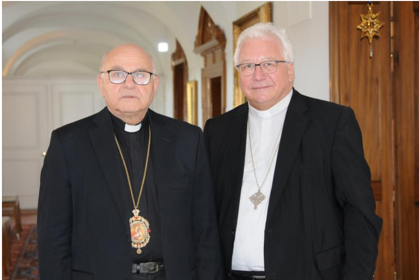
Erzbischof Jean-Clément Jeanbart aus Aleppo (Syrien) mit Bischof Markus

An der Nacht der Lichte wurden die Teilnehmenden von Bischof Markus Büchel und dem evangelisch-reformierten Kirchenratspräsidenten Martin Schmidt auch in der Bischöflichen Residenz empfangen. An diesem Arbeits- und Wohnort des St.Galler Bischofs treffen sich Orts- und Weltkirche, die barocken Räume füllen sich täglich mit Leben.